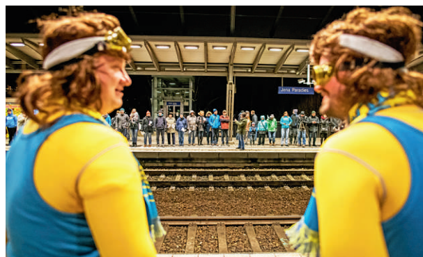
Oben und unten: Ironischer Abschied – hunderte Jenaerinnen und Jenaer „würdigten“ am Abend des 09.12.17 mit einer künstlerischen Aktion die Abkopplung der Stadt vom ICE.