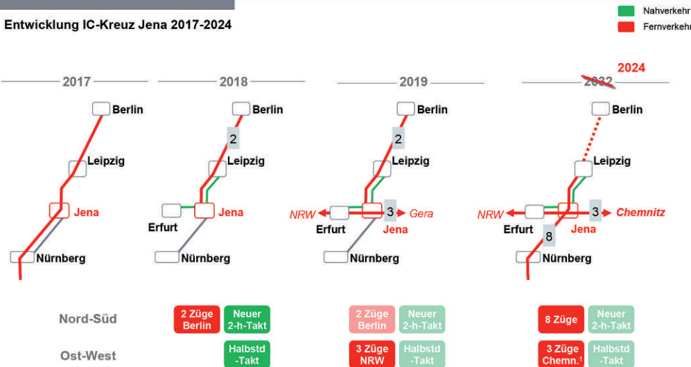
Entwicklung IC-Kreuz Jena 2017-2024