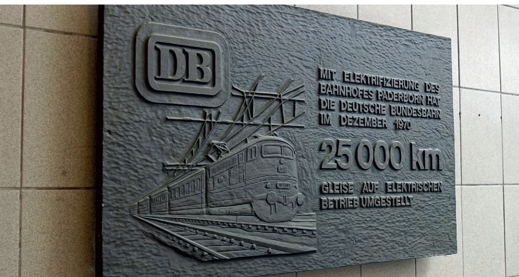
Im Bahnhof Paderborn rühmte sich die Deutsche Bundesbahn einst für die Elektrifizierung von 25.000 Gleiskilometern, die Ende 1970 abgeschlossen war. Bis 2030 sollen nun 75 % des Schienennetzes elektrifiziert sein, was knapp 5.000 weiteren Streckenkilometern unter Oberleitung entspricht.

Zufrieden zeigte sich auch der Fahrgastverband PRO BAHN und lobte dabei, „die Entscheidung, die Infrastruktursparten des DB-Konzerns gemeinwohlorientiert auszurichten“. Dieses Ansinnen wurde auch von mofair, dem Verband der Wettbewerbsbahnen im Personenverkehr, gewürdigt. Dass eine Senkung von Trassenpreisen unter Haushaltsvorbehalt steht, wurde gleichwohl bedauert. Grundsätzlich skeptischer zeigte sich das Netzwerk Europäische Eisenbahnen, das die Güterverkehrswettbewerber vertritt: „Im Güterverkehr dürfte der Vertrag nicht für eine schnelle Verminderung der Lkw-Kolonnen und des CO 2 -Ausstoßes ausreichen. Wir finden darin sehr, sehr viele einzelne Vorhaben, darunter durchaus Verbesserungen bei der Schiene, aber zugleich nur wenige messbare Kennzahlen, ein geschleiftes Treibhausgas-Sektorziel, viele Relativierungen und nur wenige Änderungen an den gesetzlichen Rahmenbedingungen,“ hieß es in einem Pressestatement zum Koalitionsvertrag von SPD, Grünen und FDP.